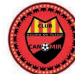
Club Can Mir